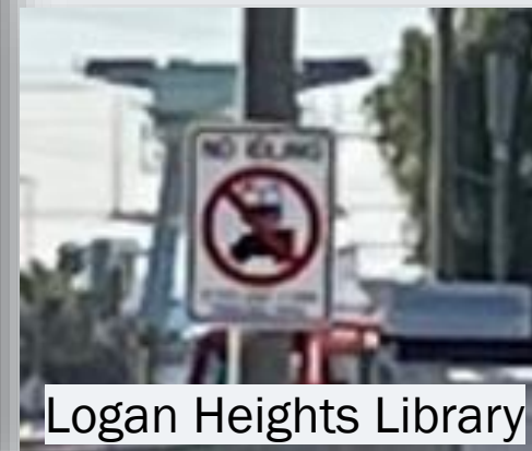
Logan Heights Library