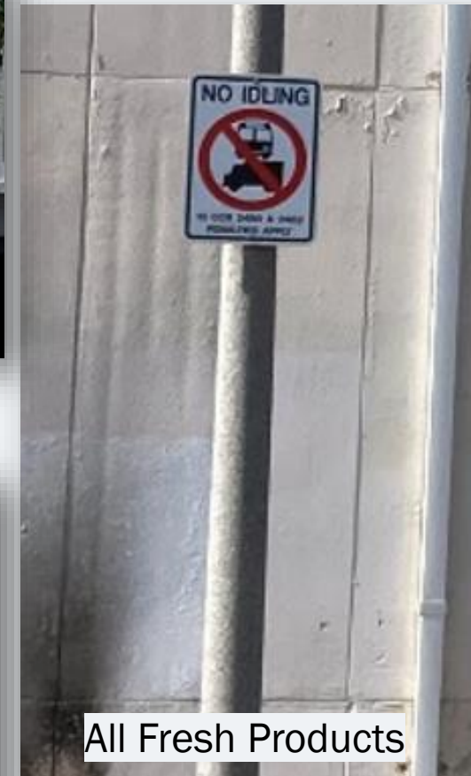
All Fresh Products